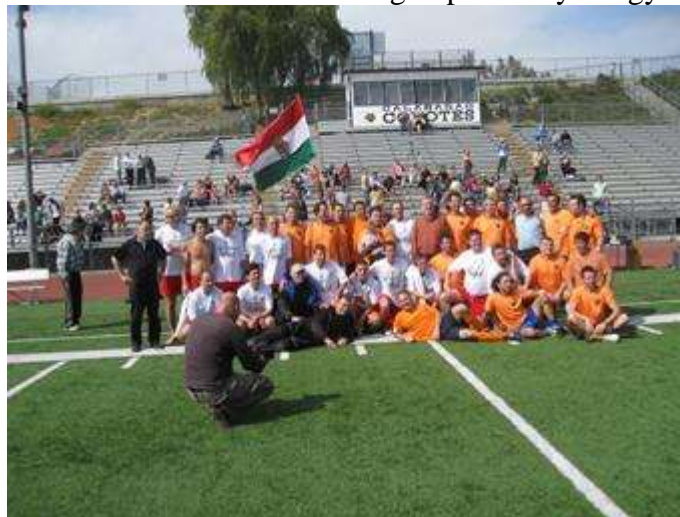
A két csapat